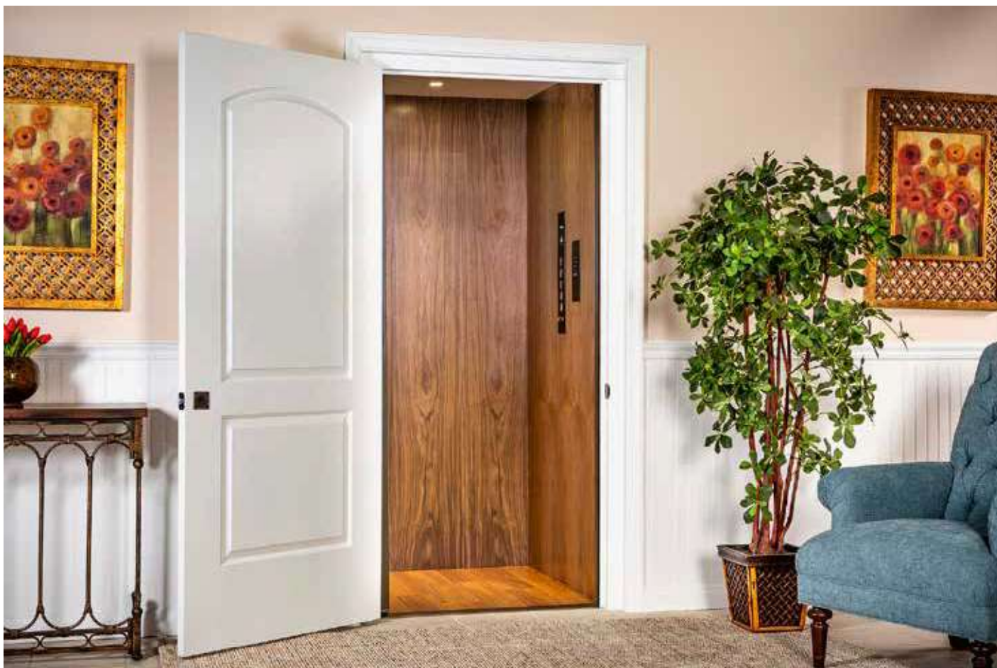
Fast unsichtbar der Flexo-Hauslift – hinter der Türe versteckt.