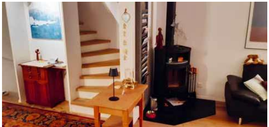
Anstelle eines Treppenlifts wird nun dort, wo der Schwedenofen steht, ein stilvoller Hauslift montiert.

fasziniert, das flexomobil mit der ZHAW entwickelt hat. Er las schon in der Zeitung, dass es ein patentierter Hauslift sei, modular, nachrüstbar, individuell und trotzdem kostengünstig. Eine clevere Erfindung für ältere Menschen, ideal für Menschen, die noch lang zu Hause bleiben wollen. Wir haben uns also entschieden: Es wird ein Hauslift von flexo-