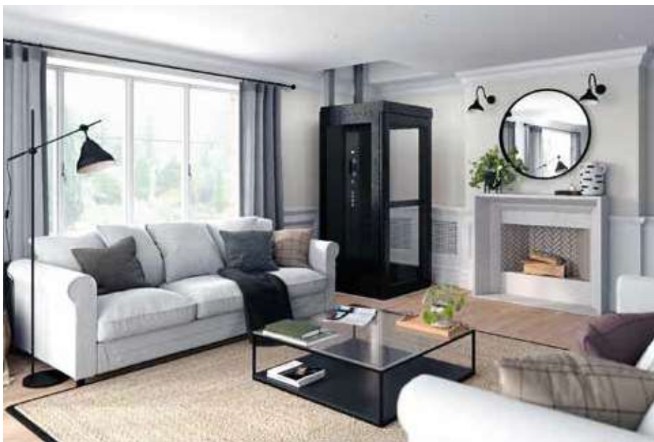
Sicher und praktisch – der senkrechte Hauslift Modell P2 in anthrazit.