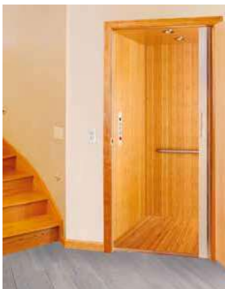
Flexo-Hauslift zum Patent angemeldet, dezent und stilvoll, zum Haus passend.